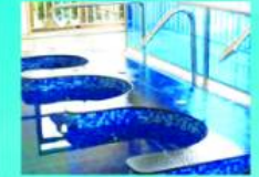
หัวฉีดไหลและที่รับ