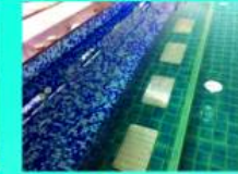
ที่นั่งนวดตัว